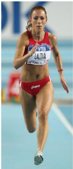
Carrera de velocidad (Fuerza velocidad)

Pruebas de velocidad en “El hombre más fuerte del mundo”: