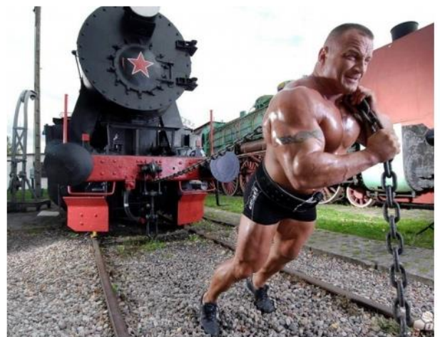
Sprint traccionando un tren de vapor (Fuerza máxima)

Diferentes pruebas de velocidad-diferentes demandas de fuerza: En cualquier prueba deportiva de sprint, la velocidad dependerá de la potencia y su relación con el peso del deportista. La potencia es el producto de la fuerza por la velocidad ( F \times V ).