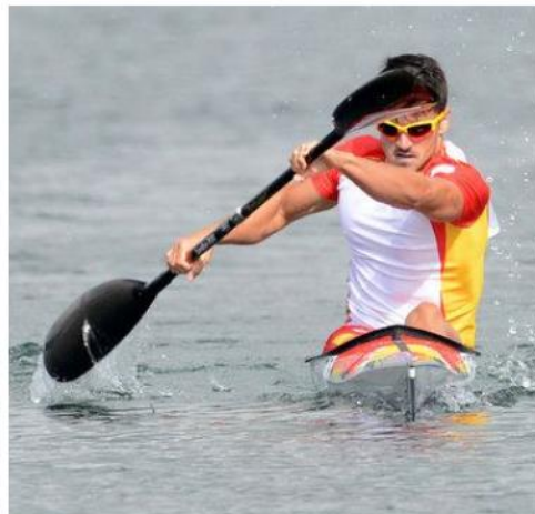
Piragüismo sprint (Fuerza explosiva)