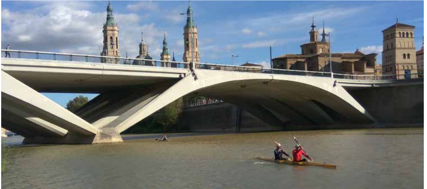
IMGS.- RFEP. Descenso del Duero. Año 2016.

NOSOTROS POR NUESTRA PARTE, fuimos capaces de conseguir el compromiso de que nos acompañaría en el tramo de Toro a Fresno. No fue fácil, pues al parecer, hacía tiempo que no se subía a una piragua, pero cumplió con su palabra y allí apareció en Toro para hacernos el honor de descender al lado de un Campeón Olímpico. No solo es un gran deportista este Narciso, es, sobre todo, un gran tipo.