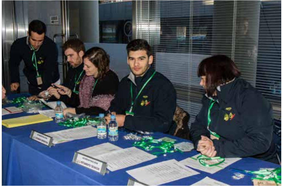
Mesa de acreditaciones. para la Asamblea

con antelación a la Asamblea. Y además, con las sedes de las distintas organizaciones de las distintas Ligas. Las fechas ya eran conocidas desde el mes de septiembre al remitirse el primer borrador, a todos los miembros de la Asamblea.