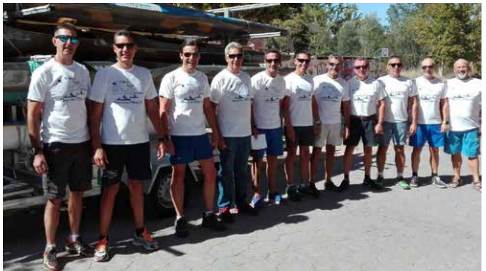
IMGS.- RFEP. Equipo del descenso del Miño, Año 2017.