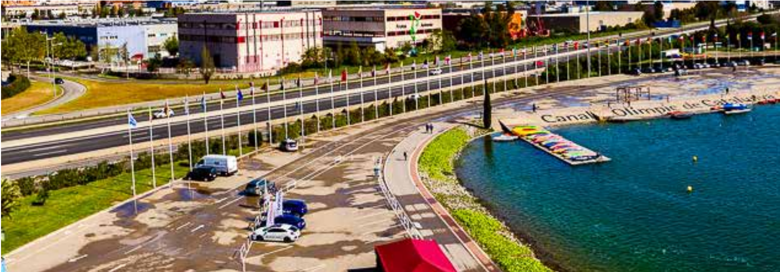
IMGS.- V. VIGAS. Canal Olímpic de Castelfdefels.

“Durante cuatro días alrededor de 300 palistas de 62 países se dieron cita en el clasificatorio mundial YOG de piragüismo, en el Canal Olímpic de Catalunya, de Castelfdefels.”