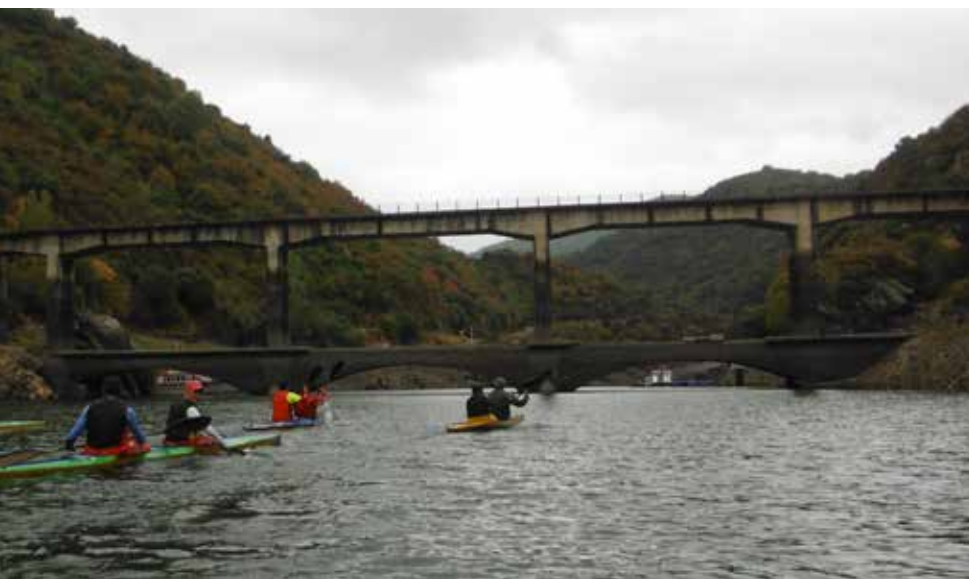
Descenso del Miño. Año 2017.