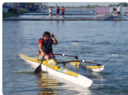
Longitud máxima: 730 cm Peso mínimo: 10 kg excluyendo ama y iako Sin timón