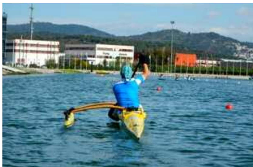
Tuvieron la oportunidad de probar la Va'a.

al equipo que participará en el Campeonato del Mundo.