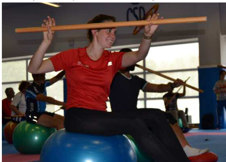
Ejercicios de paleo sobre fit-ball.

miento, manutención, ubicación, proceso de inscripción), valorados en esta ocasión sobre 5 puntos, obtuvieron una media superior a los 4,5 puntos en conjunto,