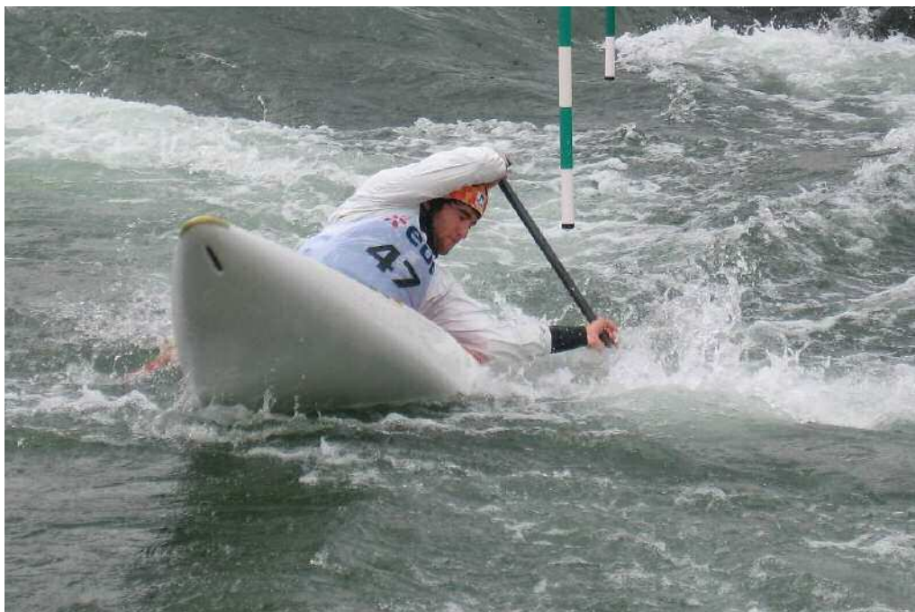
La C-2 de Pérez y Marzo durante las pruebas de selección de Pau.

han luchado para dar lo mejor de ellos mismos, y realmente pienso que los que se han clasificado para el