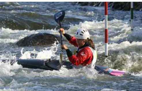
Imagen: Agustí Cucurrulls

convertido en el cuartel general del Equipo Nacional, donde nuestros palistas pueden entrenar en un escenario de primer nivel, con unas condiciones de confortabilidad y fiabilidad inmejorables.