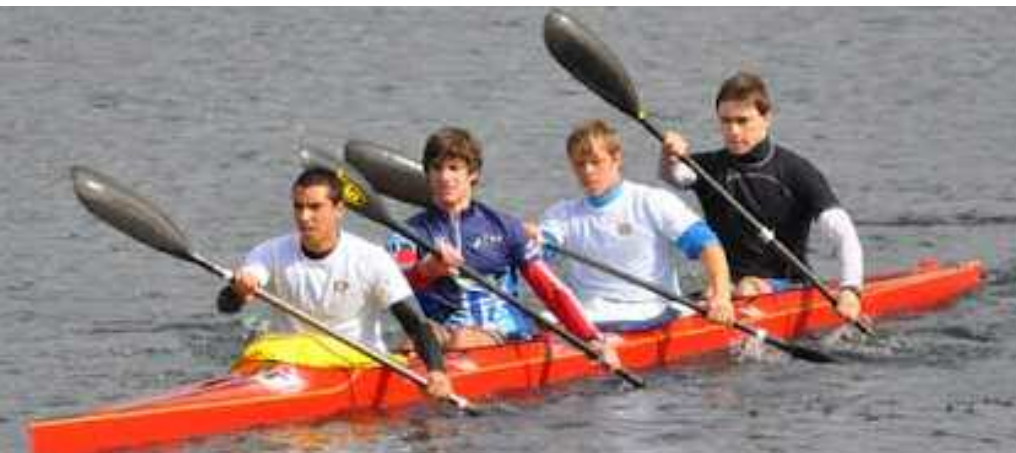
Embarcación de equipo.

La próxima cita de pista será los próximos 12 y 13 de mayo, con Verducido repitiendo como anfitriona de la Copa de España de 200 y 500 metros.