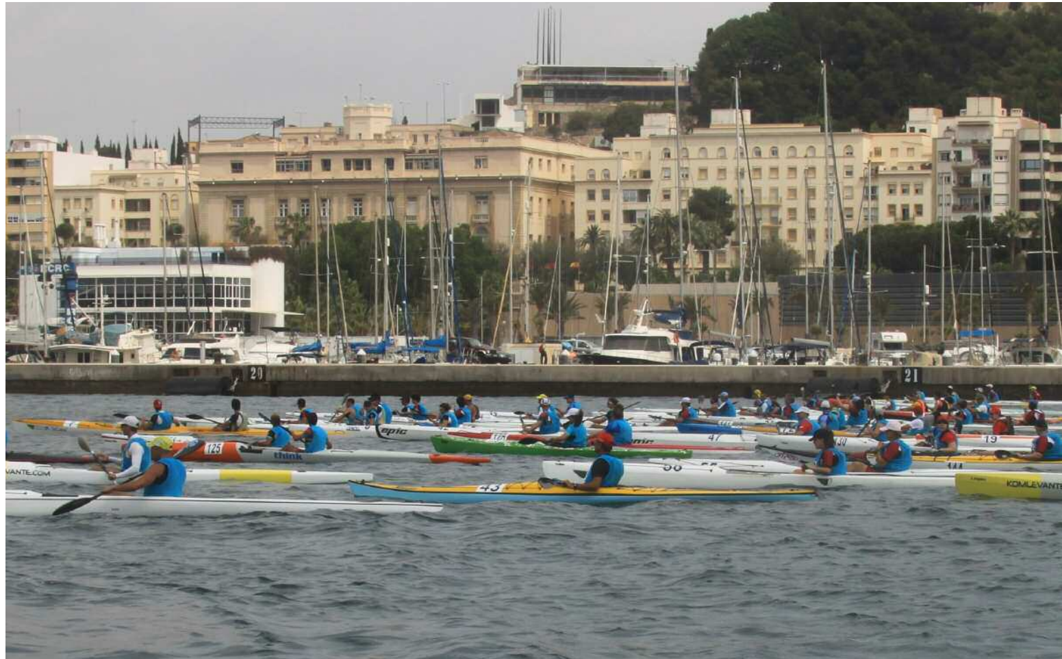
Kayak de Mar en aguas del Mediterráneo durante la III Copa de España de Kayak de Mar, en Cartagena.

“La práctica de actividades deportivas en playas y costas, en el mar, son parte de la tradición cultural de nuestros pueblos costeros, fácilmente exportable a otros colectivos del interior”