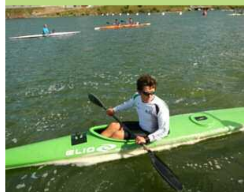
Imágenes: Carmen Adell