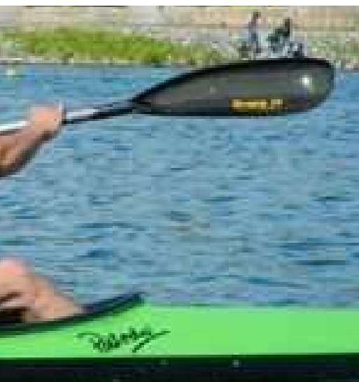
undo Clinic de Paracanoe. Imagen: Carmen Adell

Esta vez, al igual que la anterior, se pudieron grabar en vídeo las carreras y compararlas con las del primer clinic, dando cuenta de una mejora considerable