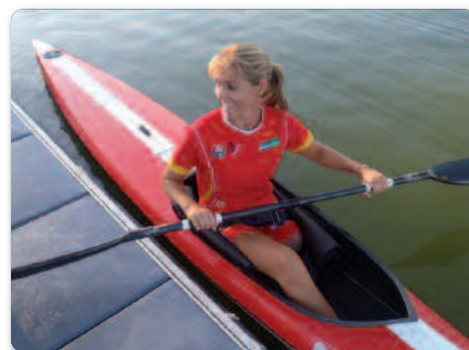
Longitud máxima: 520 cm Anchura mínima: 50 cm (medido 10 cm a partir de la parte inferior del casco) Peso mínimo: 12 kg