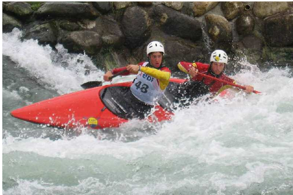
La C-2 de Domenjó y Ganyet durante las pruebas de selección de Pau.

que estar muy contentos y satisfechos de la elección de Pau como Selección Olímpica.