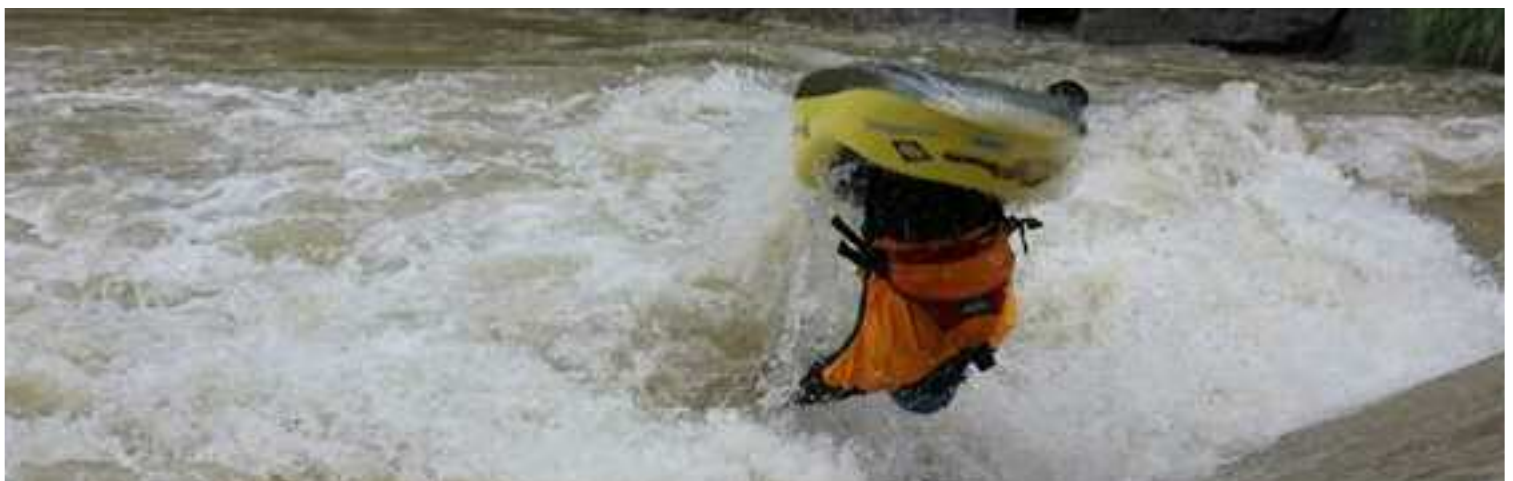
Joaquim Fontané, primer palista en ser campeón de Europa de Estilo Libre en K-1 senior.