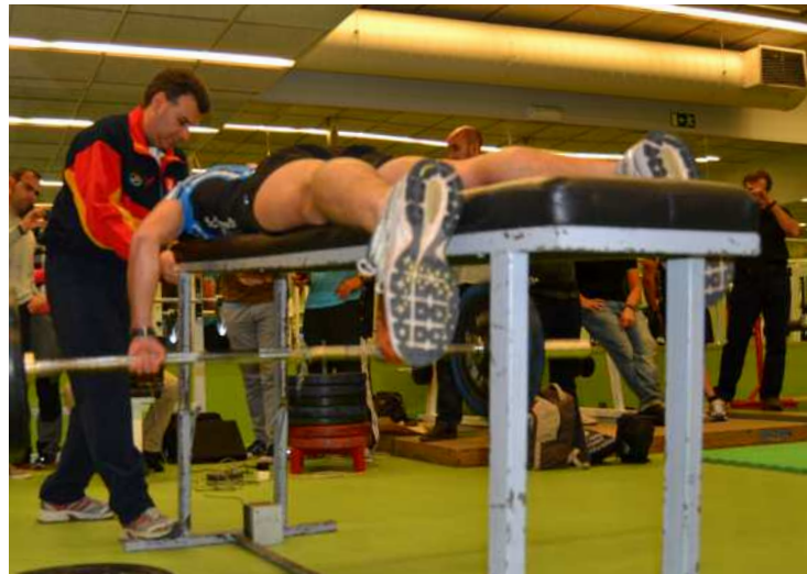
Prácticas con máquinas específicas.

Tras las jornadas, realizamos una encuesta anónima de valoración de las mismas donde se puntuaron cada una de las ponencias, así como diferentes aspectos relacionados con la organización de las mismas. Es destacable que en las puntuación de las po-