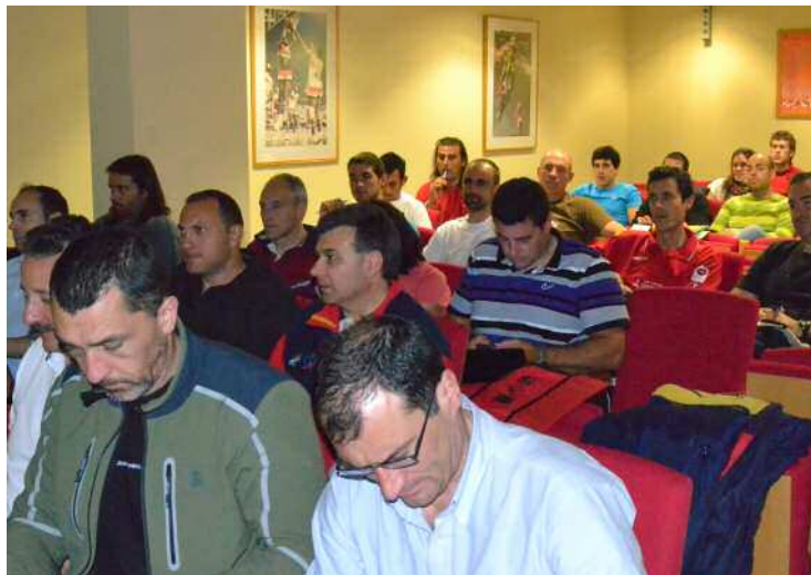
Asistentes al Clinic de la ENEP.

la colaboración de los ponentes y del COE, CSD y al CAR Residencia Blume para el buen desarrollo de las mismas. Os emplazamos desde la ENEP al IV Congreso Internacional de Entrenadores de Piragüismo de Aguas Tranquilas que se desarrollará en el mes de octubre en Catoira (Pontevedra).