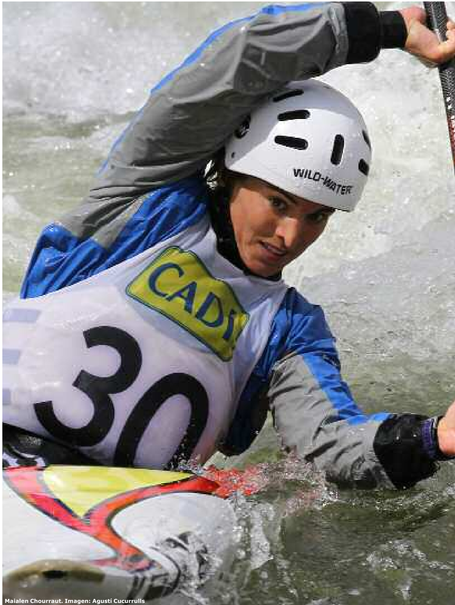
Maialen Chourraut.