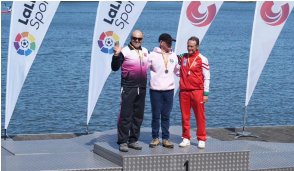
IMG. CLUB SILLA. Copa España de Sprint, Trasona, Abril 2019

de Silla otorga a personalidades o entidades del pueblo de Silla que durante su trayectoria tanto profesional como personal han destacado dentro del difícil mundo del deporte.