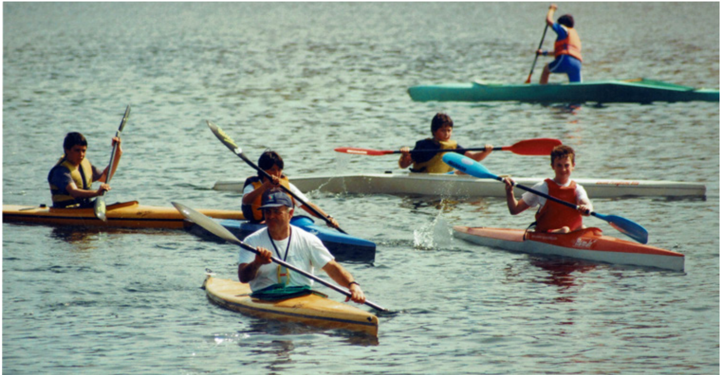
IMG. CLUB SILLA. Primeros años como entrenador

agregándose a sus salidas en piragua palistas más jóvenes, padres y madres recientemente iniciados que buscaban su enseñanzas magistrales, teniendo como lema “lo importante es participar”.