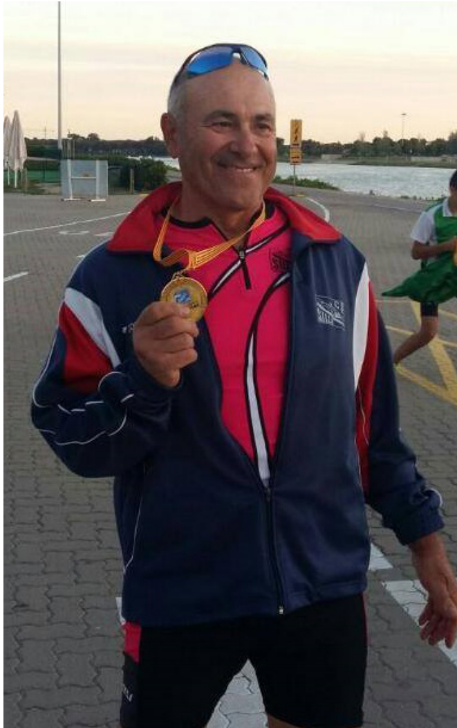
Medalla de oro en la Liga Este, 2017, Canal Olímpico

COMO ENTRENADOR, EN ESTOS últimos años, tuvo la iniciativa de agrupar a los veteranos que entrenaban dispersos en la Albufera de Silla, contribuyendo a formar un grupo unido y cohesionado, los llamado "Chipiritiflauticos", que bebían de sus enseñanzas técnicas y experiencias como piragüista. Cada semana remitía el entrenamiento según las pruebas a abordar y poco a poco fueron