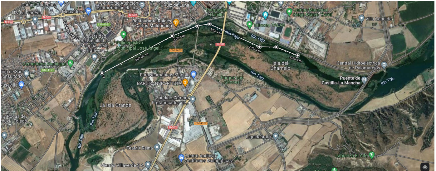
*Distancias desde 0 hasta primera ciaboga*