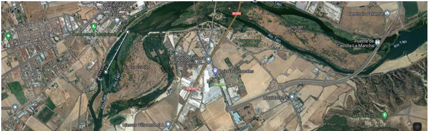
*Distancia desde 0 hasta ciaboga 2, la ciaboga será a los 500m pero se contabilizan +50m como margen de seguridad extra a la presa además de los metros reglamentarios*