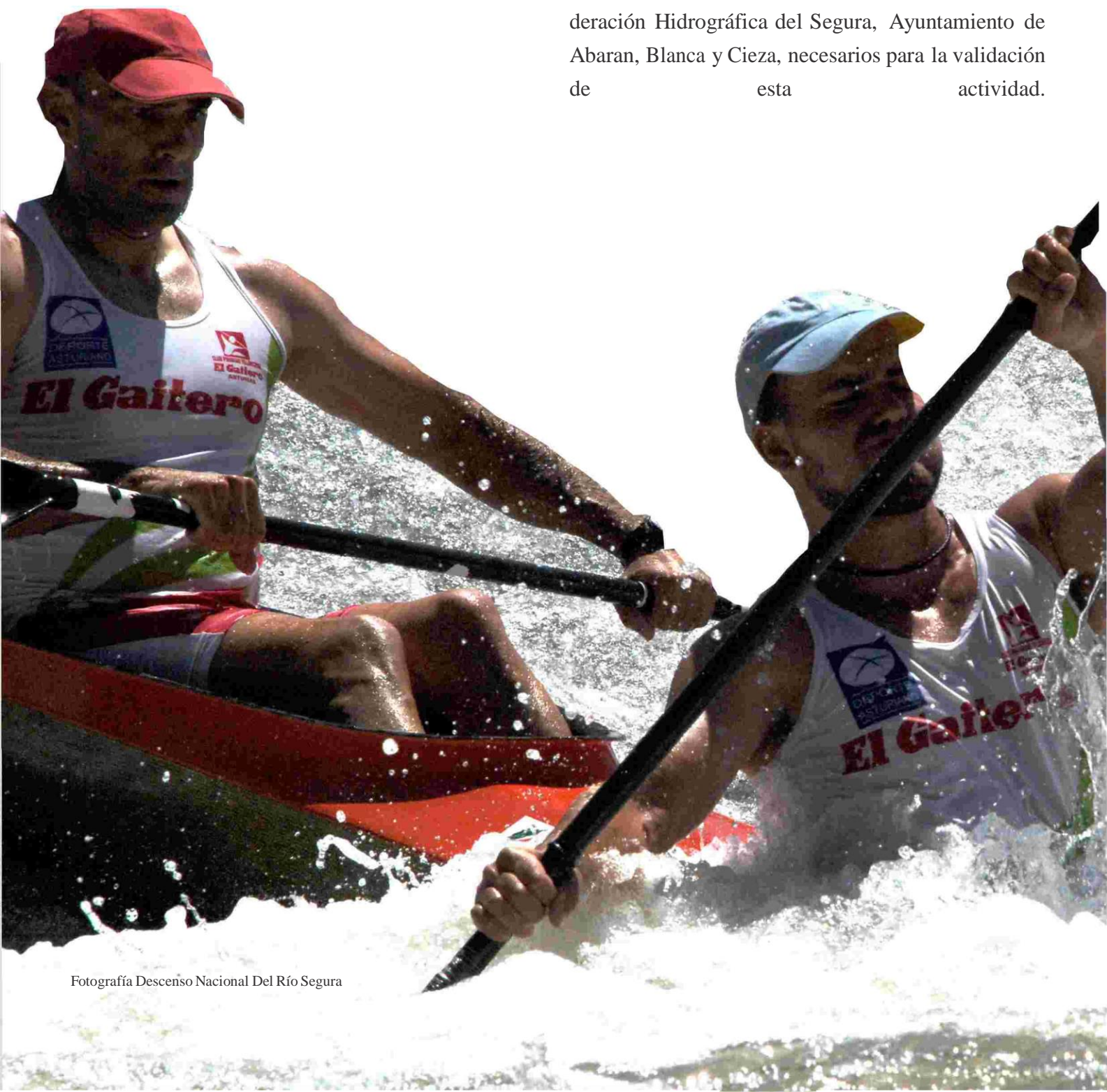
Fotografía Descenso Nacional Del Río Segura

El descenso cuenta con los permisos oportunos de la Delegación del Gobierno en la Comunidad Autónoma de Murcia, a la Dirección General de Interior de la Comunidad Autónoma de Murcia, a la Confederación Hidrográfica del Segura, Ayuntamiento de Abaran, Blanca y Cieza, necesarios para la validación de esta actividad.