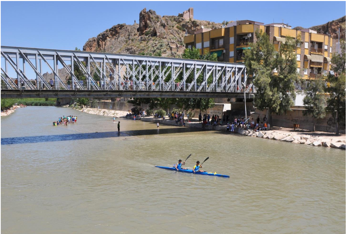
Fotografía Descenso Nacional Del Río Segura

Por ser esta prueba de carácter nacional tendrá más repercusión, debido a la gran cantidad de clubs deportivos y de miembros de la federación española. Dispondremos de varios puntos estratégicos en la prueba para que el descenso pueda llegar a aquellas personas que no asistan en directo.