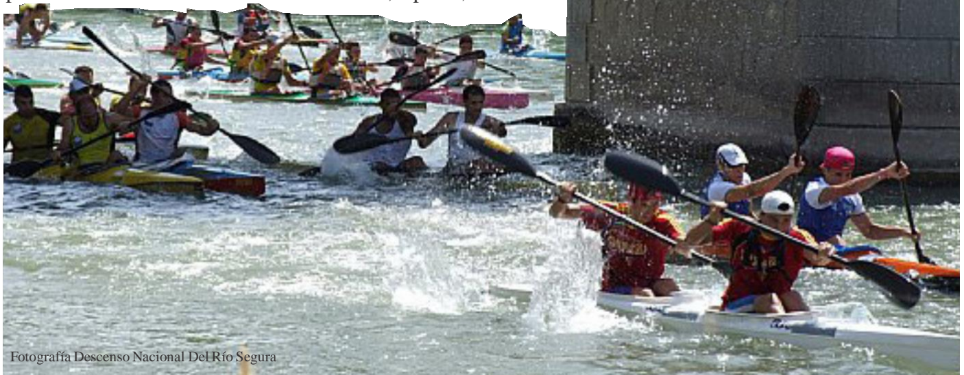
Fotografía Descenso Nacional Del Río Segura

Deporte, competición, tradición, y amor por la naturaleza. Esos son los ingredientes que componen nuestros atletas, deportistas que vienen de lejos y siempre se sienten como en casa.