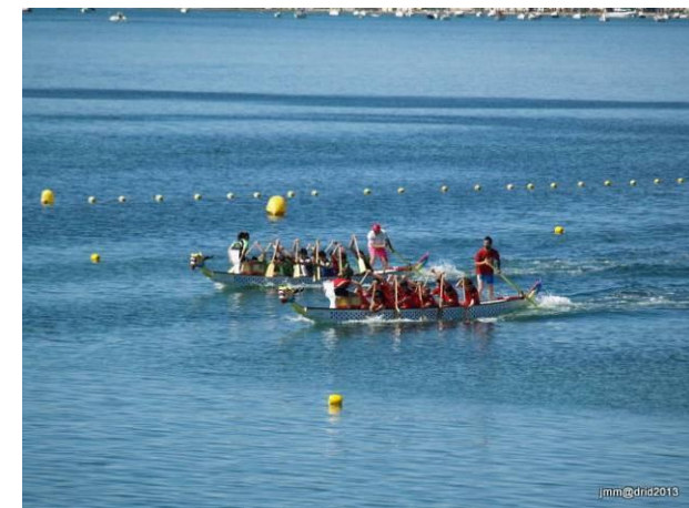
Festival Dragonboat San Pedro del Pinatar 2013.