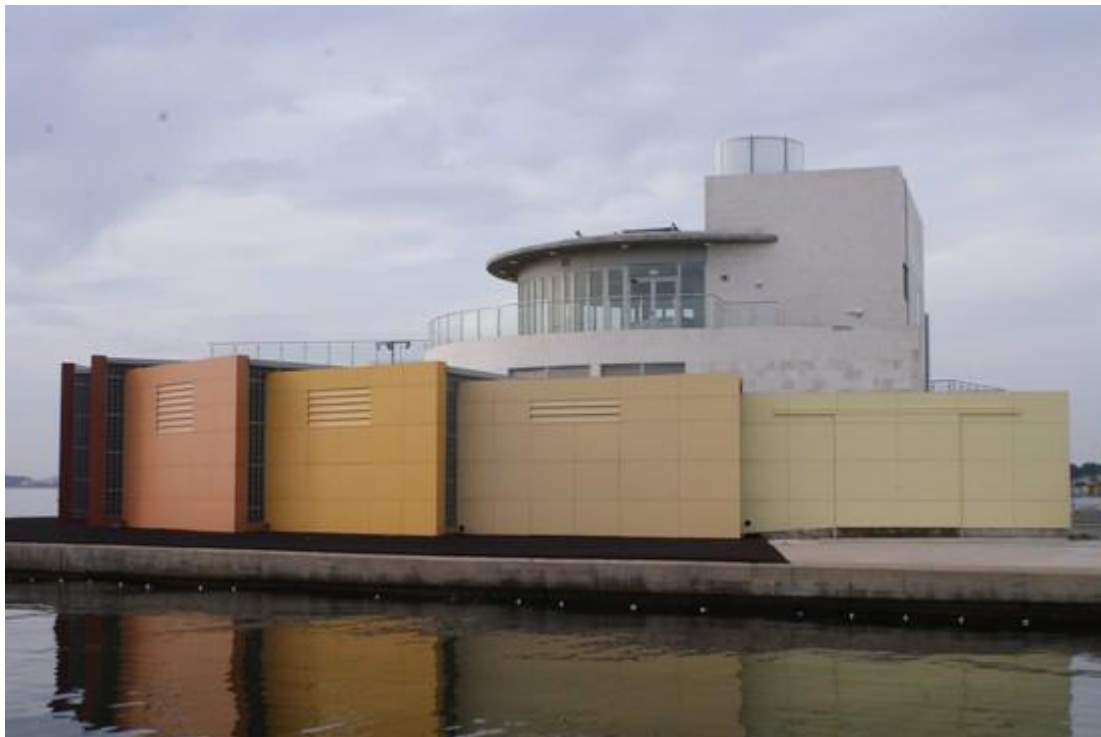
Centro de actividades náuticas de San Pedro del Pinatar.