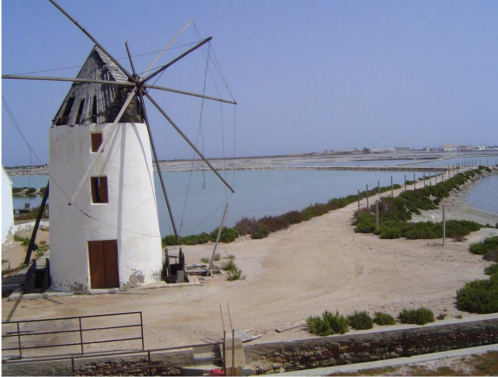
Molinos de San Pedro del Pinatar.