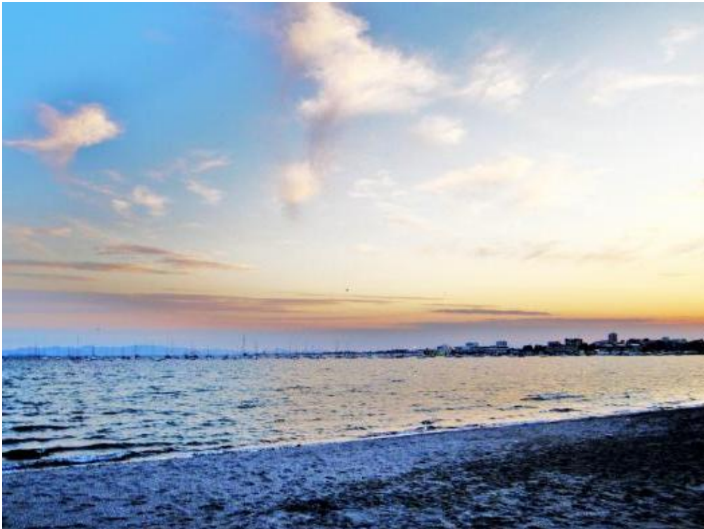
Playas de San Pedro del Pinatar