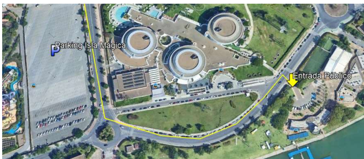
Parking Isla Mágica

Nota: Debido a un duatlón que se lleva a cabo el domingo 16 de marzo en el Parque del Alamillo entre las 08:30 y 13:00 horas aproximadamente, el acceso al parking del Alamillo en este tramo horario será por el Puente del Alamillo.