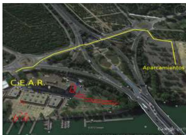
Acceso: Parking Alamillo