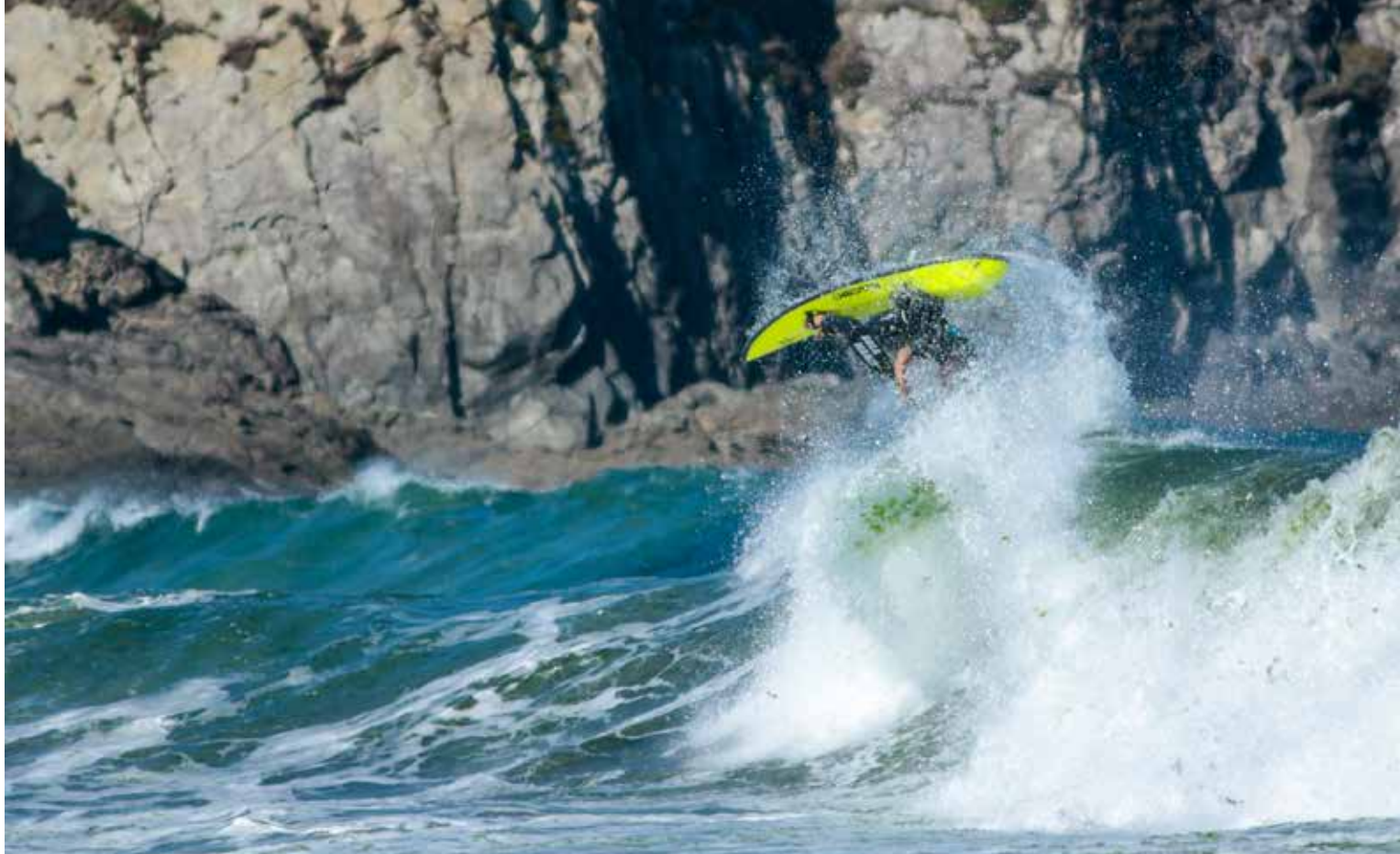
Competición realizada en Pantín

FINALMENTE DECIR QUE EN el año 2016 (Mundial de Waveski celebrado en Santa Cruz, Portugal), el equipo español resultó vencedor en la categoría por equipos denominada "Tag Team", siendo un logro histórico al quedar por delante de selecciones favoritas como Francia y Australia.