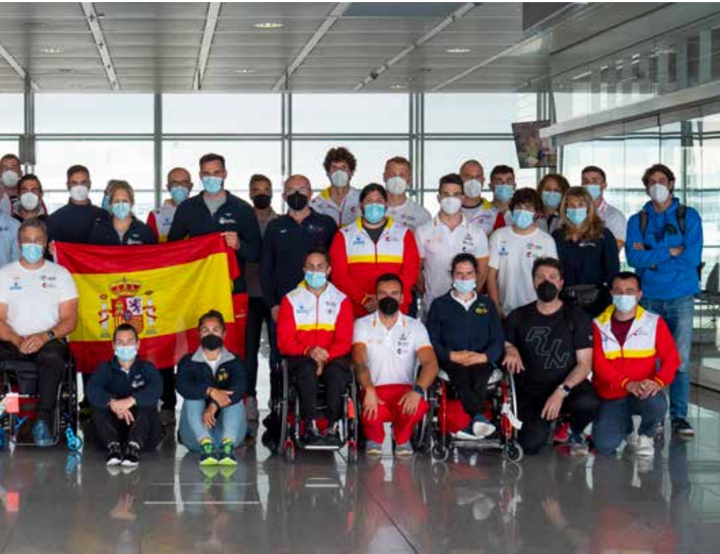
MG. RFEP. Un gran equipo camino de Sseged.