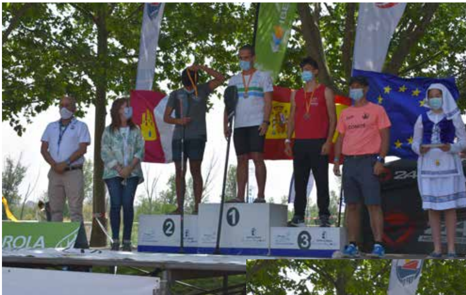
Podium categoría hombre junior