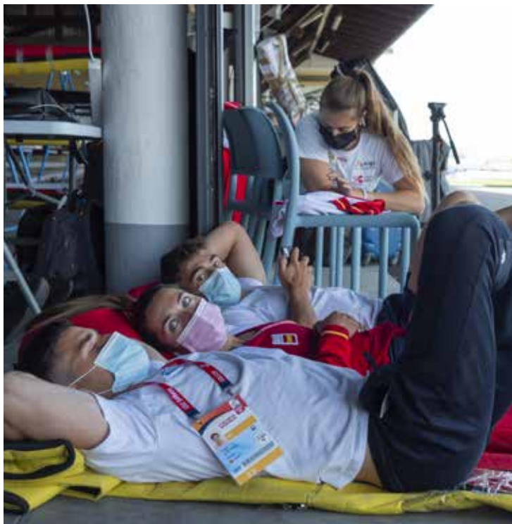
IMG. RFEP. A la dcha. cita inevitable: test de COVID-19, a la izd. momentos de relax.

LA SIGUIENTE EN ENTRAR en escena fue Isabel Contreras. Después