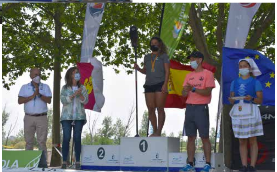
Podium categoría mujer junior