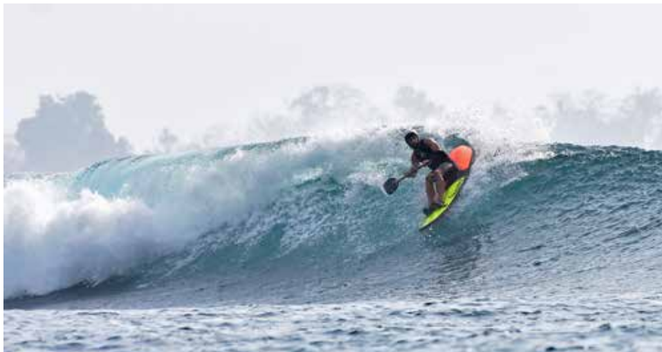
Competición realizada en Pantín