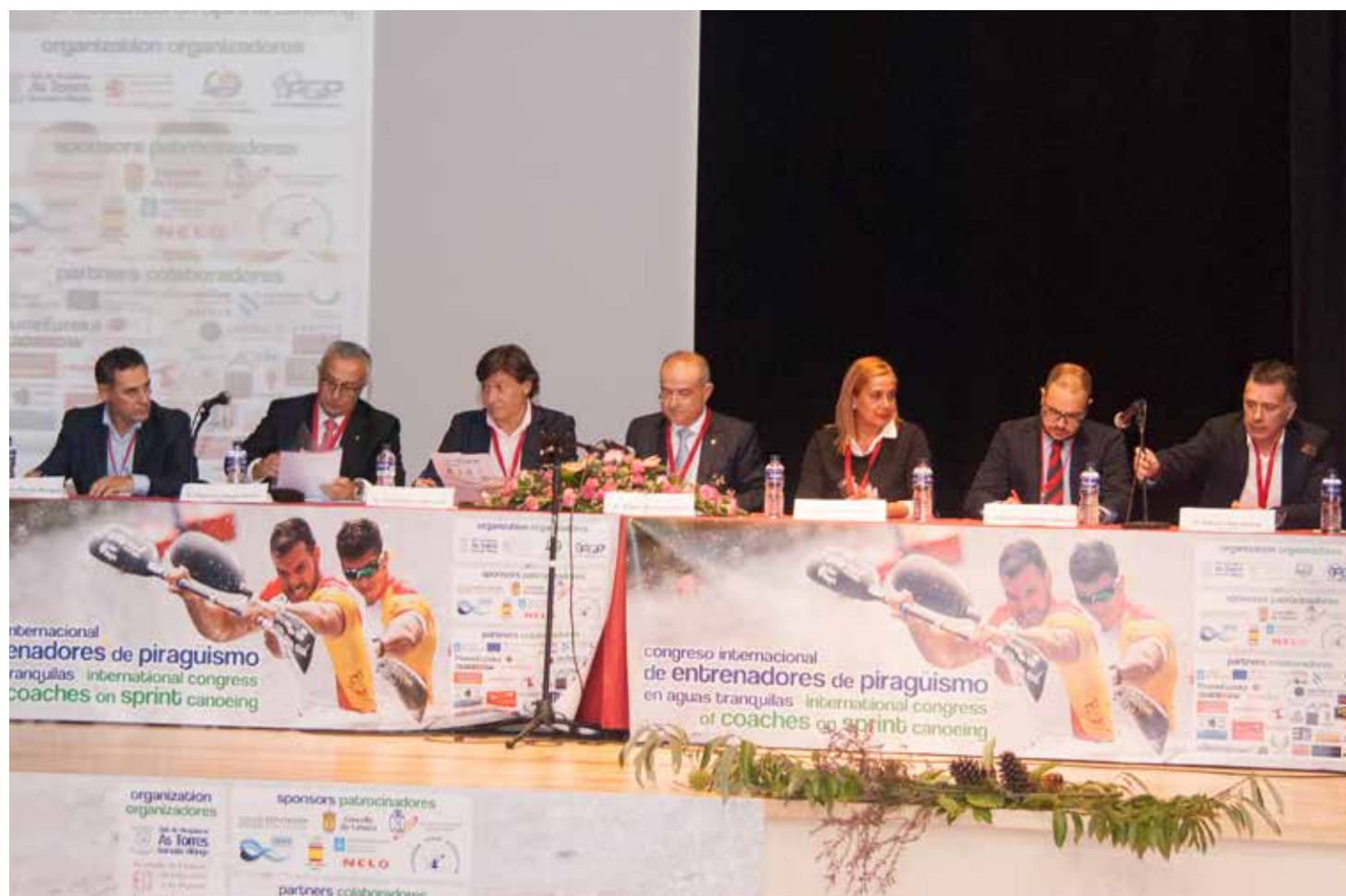
Mesa presidencial del Congreso de Catoria.