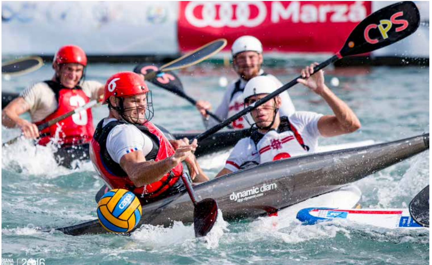
IMG. ORGANIZACIÓN CAMPEONATO. La lucha por el balón se mide en cada cm.