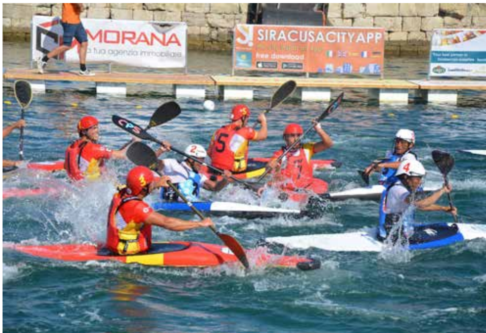
IMG. KAYAK FIUME CORNO FUG, Desfile inaugural con el equipo español, a la izquierda partido España-China Taipéi

sición de Director Técnico y Seleccionador del equipo senior masculino.