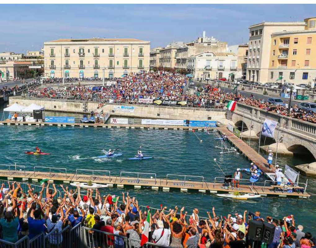
Panorámica del partido España-Italia