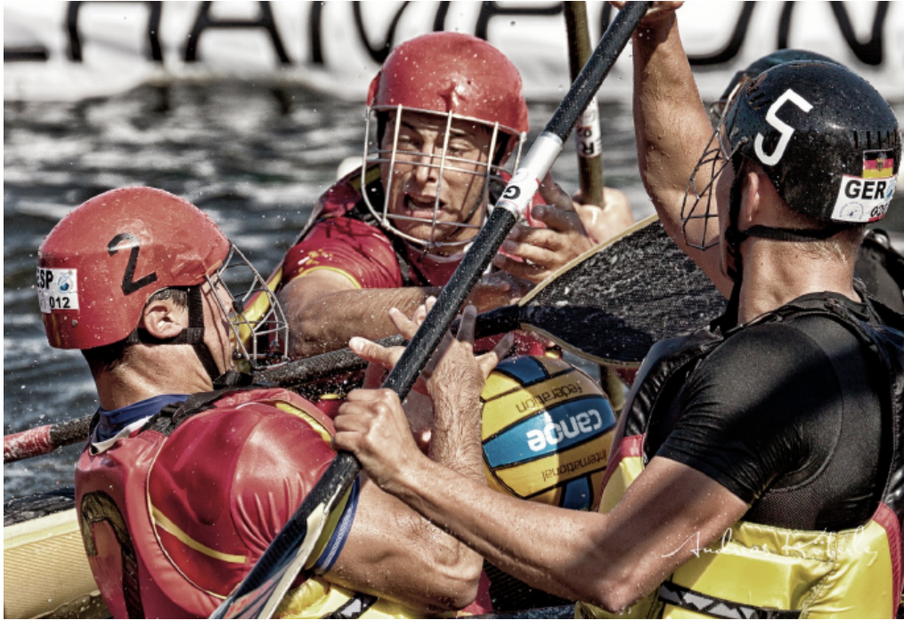
Los chicos sénior contra Alemania durante el Europeo de 2013.