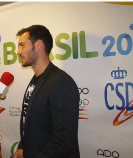
...meros carnés de socios solidarios. Abajo, mu- la presentación del proyecto.