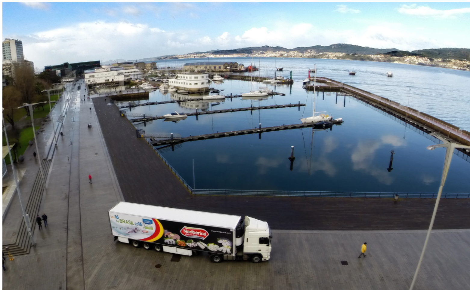
El Puerto de Vigo, escenario privilegiado que sirvió de marco para la Presentación de Noribérica como socio patrocinador de 'Los 16 de Brasil 2016'.

“Es un proyecto ambicioso pero también generoso, que según el presidente de la RFEP contribuirá a “hacer un piragüismo mucho más fuerte y participativo de cara a los Juegos Olímpicos”