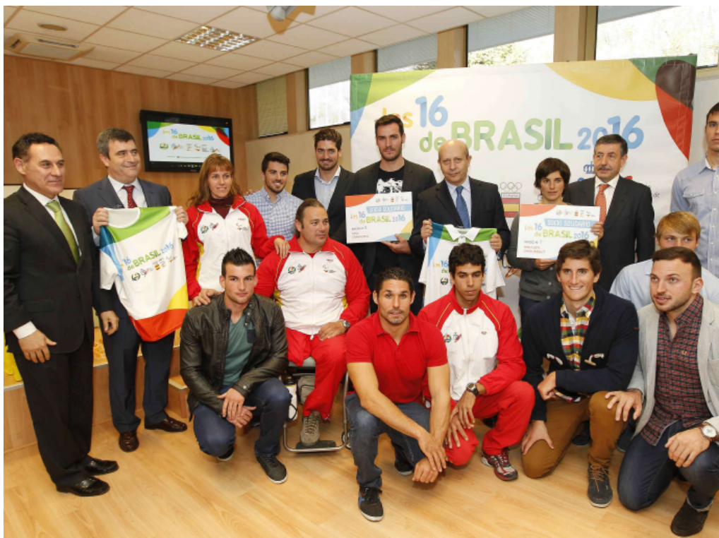
Un amplio grupo de palistas acudió al CSD a apoyar la iniciativa de la RFEP.

Wert: "El piragüismo es un deporte de esfuerzo, solidario y en contacto con la naturaleza. Esos son valores muy interesantes que las marcas pueden aprovechar"