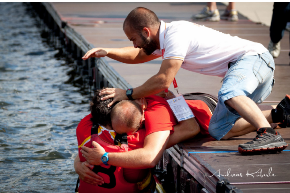
Durante el Europeo, celebrando la esperada medalla.

“Esta segunda generación gracias a que aprendió de la anterior y peleó para ser mejores que ellos llevan el entrenamiento del kayak polo a un nivel superior”