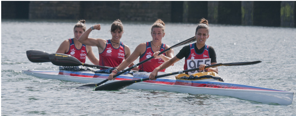
El K-4 femenino del Covadonga durante el 75 aniversario del Club.

las dos temporadas de juvenil ganó los selectivos de 500 m en K-1 y compitió en los Europeos de pista en Portugal y en Poznan, en el mundial de maratón en Roma y en su última prueba, el K-2 500 m en el Mundial de Canadá donde consiguió la medalla de plata junto a su compañera Sara. Este resultado, el mejor conseguido hasta la fecha por un K-2 juvenil femenino español en un mundial, la convierten en una de las más sólidas esperanzas de nuestro piragüismo a medio plazo. De su experiencia internacional destaca: "Ha sido muy satisfactorio estar ahí después de todos los años de trabajo y espero poder