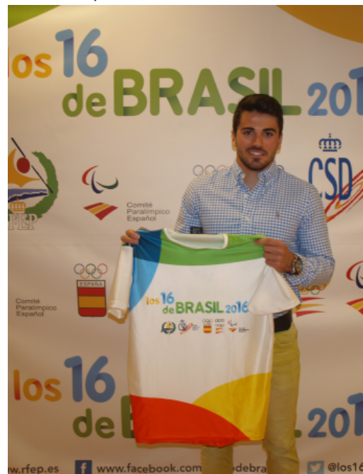
Francisco Cubelos, diploma olímpico en Londres 2012, también prestó su apoyo al proyecto 'Los 16 de Brasil 2016'.

“Palistas como Saúl Craviotto o Maialen Chourraut, medallistas en Londres 2012, se muestran ilusionados con la iniciativa de Los 16 de Brasil 2016”