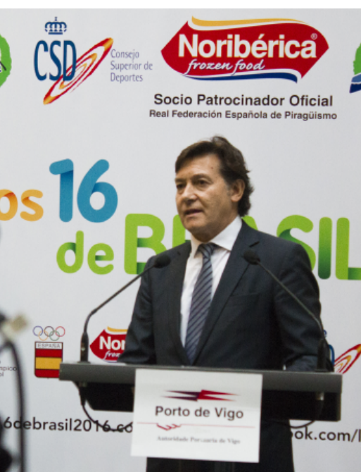
Portuaria de Vigo, ejerció de anfitrión.