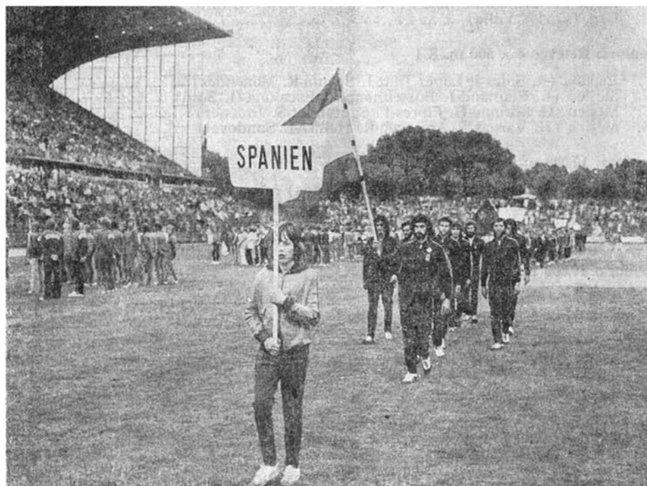
Desfile del Equipo Español de Piragüismo en Duisburg (Alemania Occidental) con motivo de las Regatas Internacionales «Jubileo de la I. C. F.», celebradas en Julio de 1974.

Teniendo en cuenta que en estas regatas participaron 28 naciones y que han sido consideradas de nivel igual o superior al de unos campeonatos del mundo, los resultados del equipo nacional en 1.000 metros K-1, 1.000 metros K-4, 10.000 metros K-2 y 10.000 metros K-4, se consideran muy buenos. La organización, a cargo de la Federación alemana, fue perfecta. El más destacado fue el sexto puesto conseguido por nuestra K-4 en la final de 1.000 metros.