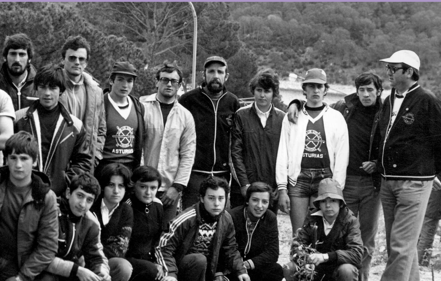
El equipo de Los Gorilas de Candás, Campeones de España de Larga Distancia en abril de 1977