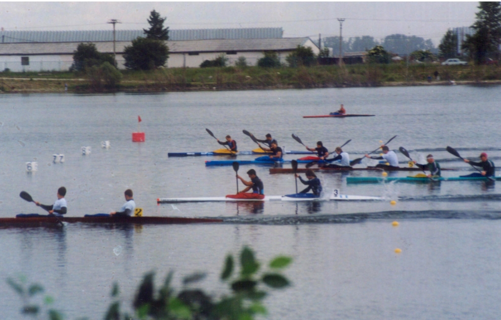
Regata de Bratislava, 1998.

dial de Aveiro, Portugal y finalizó en séptima posición. Excelente arranque mundialista de esta modalidad que al año siguiente comenzaría a disputar la Liga Nacional.