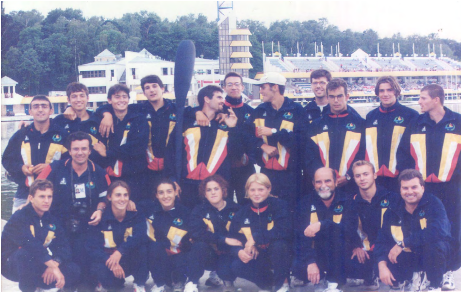
Arriba, el equipo participante en el Campeonato de Europa del año 1996. Abajo, Campeonato del Mundo Szeged, 1998.

anotados por muchos técnicos en su día pasan al contenedor de reciclaje de papel.