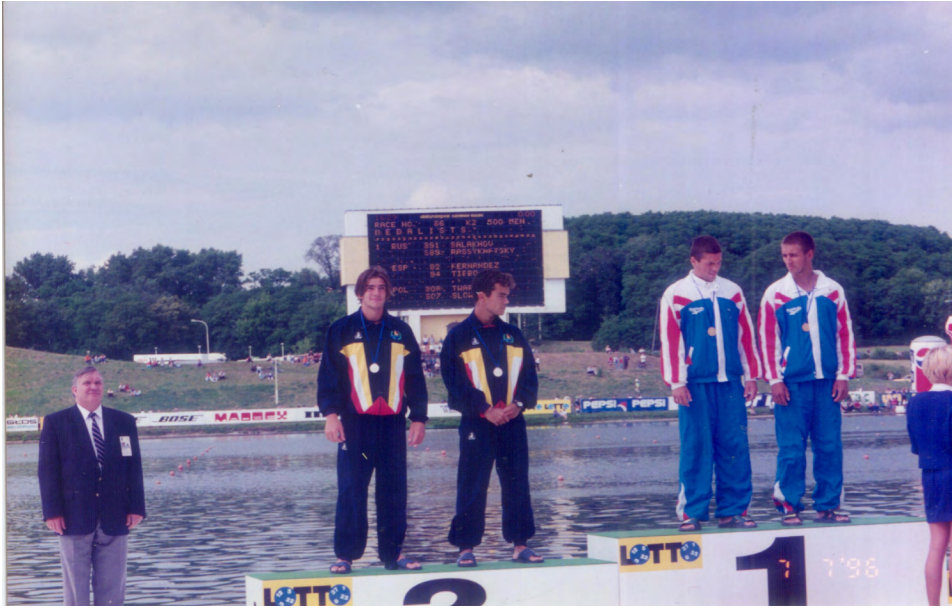
Derecha, Cto. Europa Junior 1996. Abajo, Regata de Bratislava, 1998.

en kayak fue un desastre sin ningún palista en finales.