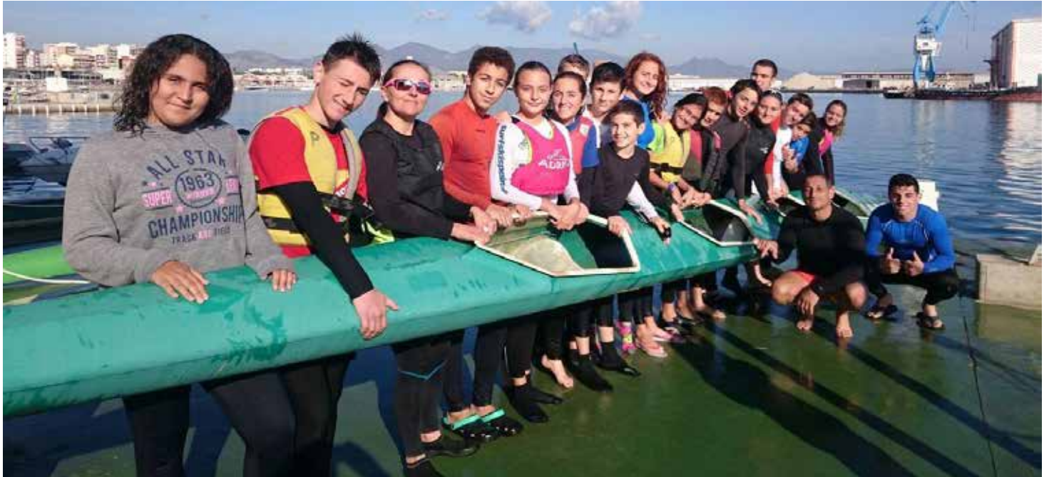
IMG. C. N. CASTELLÓN. Nuestros JJPP en nuestras instalaciones