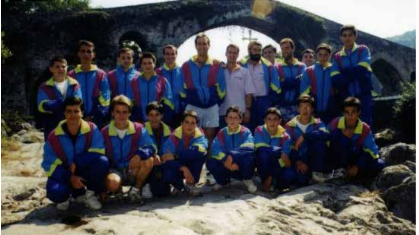
IMG. CLUB P. SIRIO. Foto de equipo año 1992