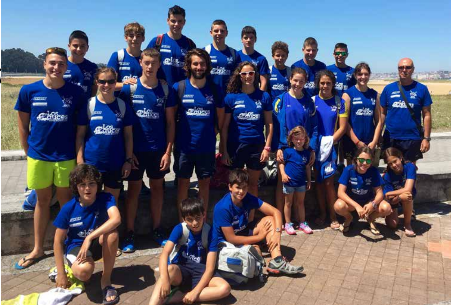
IMG. CLUB P. SIRIO. Dos foto de equipo a través del tiempo, arriba año 2016, abajo año 1975