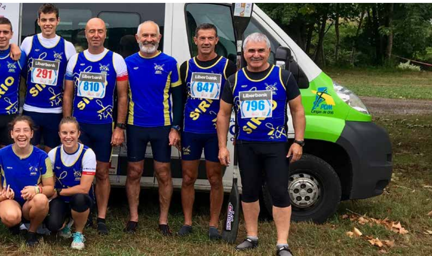
Arriba, Equipo Sella 2017

Asturias sea bastante extensa a lo largo de la historia de nuestro club, y que la lista de triunfos abarque la mayoría de las pruebas que se celebran en el territorio español.