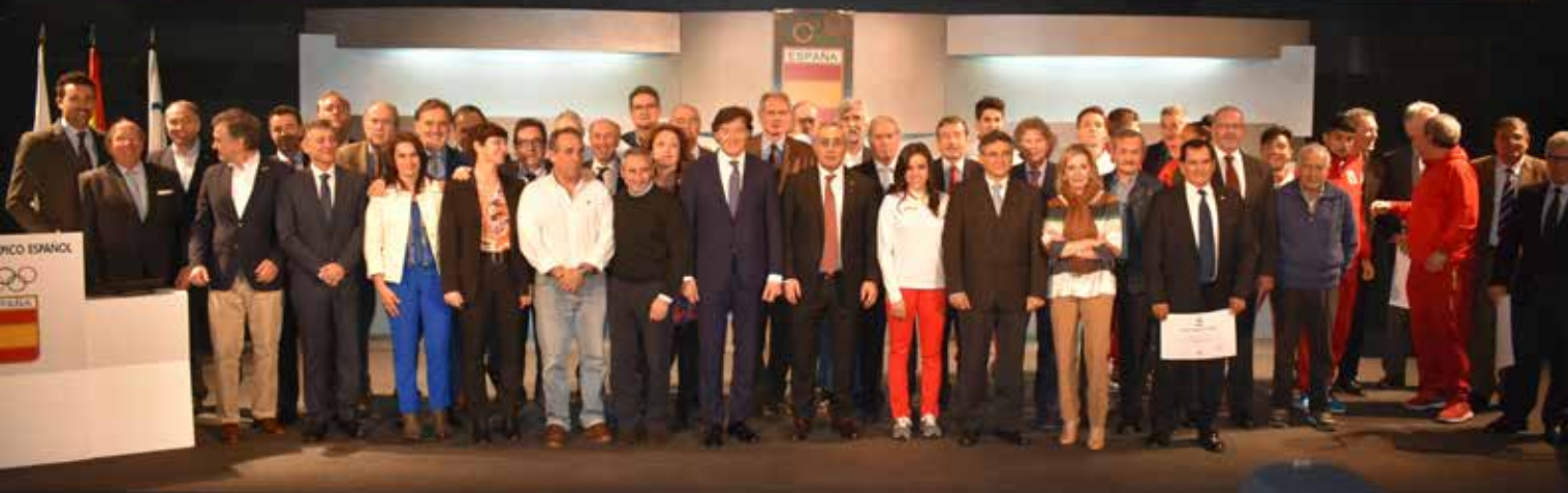
Instantánea de todos los premiados y autorizadas asistentes al acto.