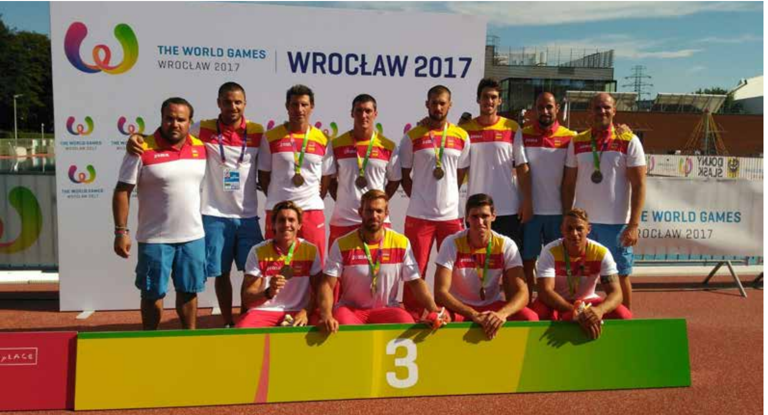
IMG. RFEP. Arriba El equipo ganador al completo.