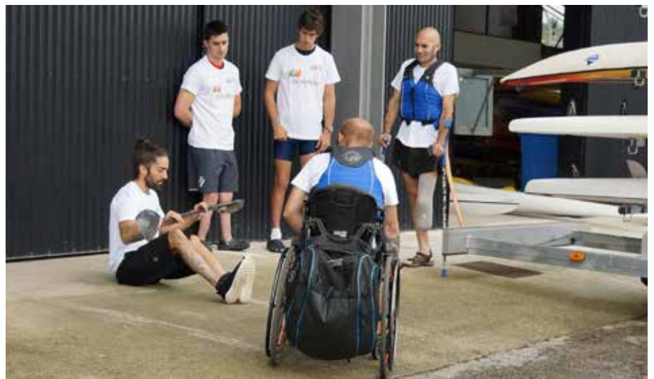
IMG. RFEP. A la Izd. grupo participante en el Clinic del País Vasco

do de discapacidad reconocido igual o superior al 33%, distribuido según Comunidades Autónomas, provincias y sexo.