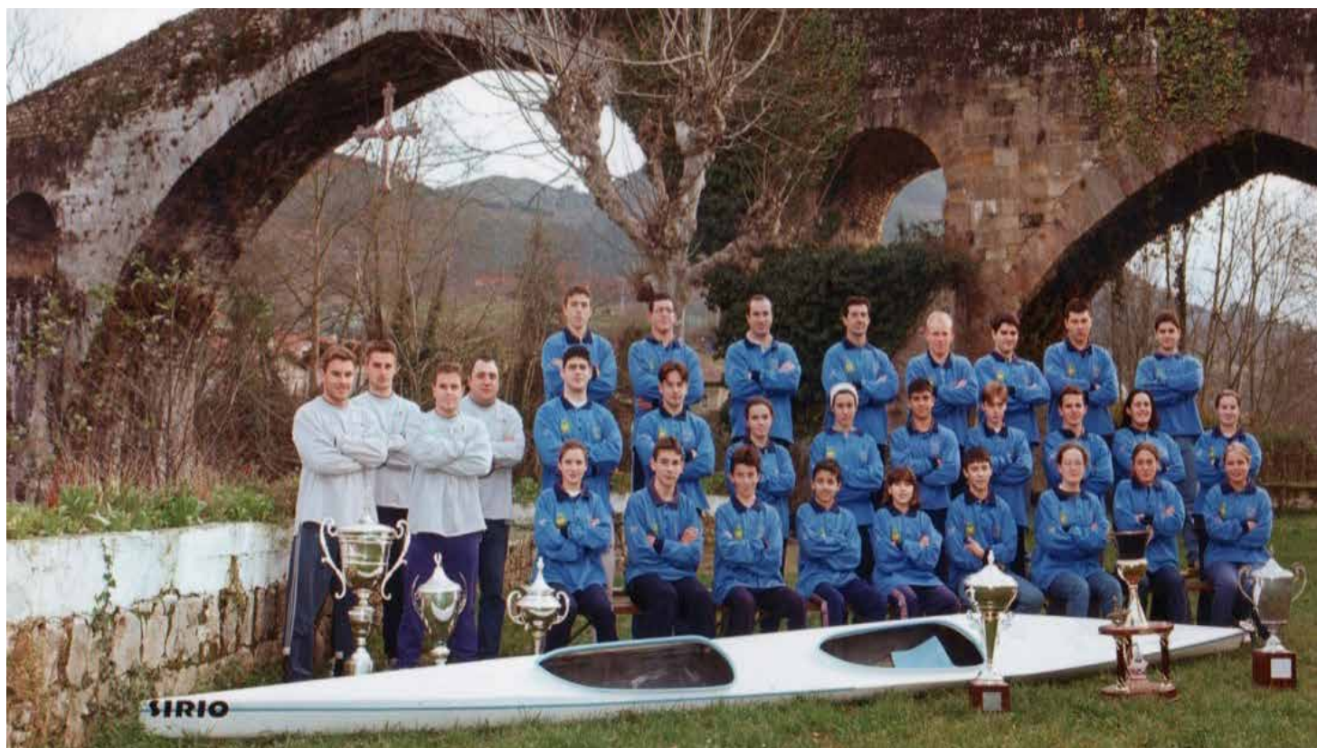
IMG. CLUB P. SIRIO. Foto de equipo año 2000