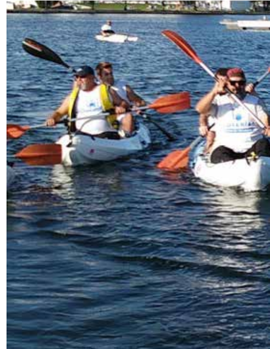
IMG. RFEP. Grupo participante en el Clinic de Islas Baleares.

ha comprobado mejoras significativas mayores, en comparación con otras actividades, en valores de Fuerza máxima, Fuerza resistencia, Resistencia, Coordinación y Equilibrio. Capacidades y Destrezas que ayudan y repercuten sustancialmente en la mejora de la autonomía y la autoestima personal.