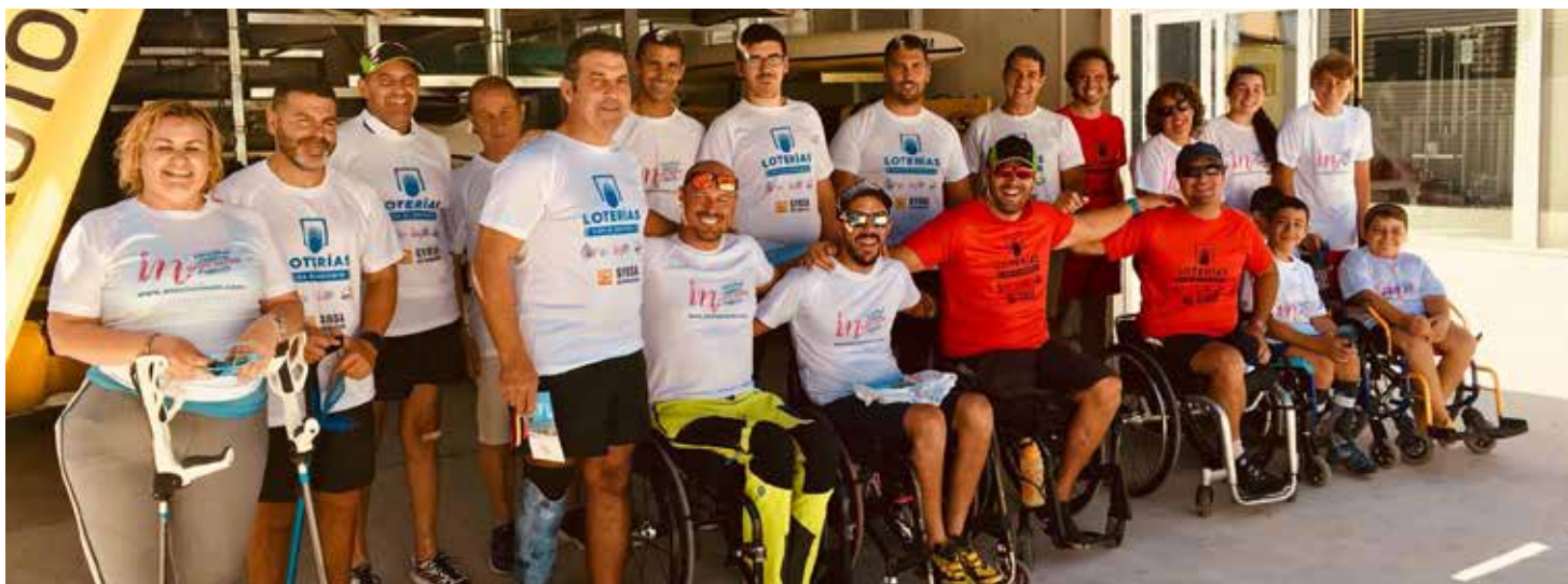
IMG. RFEP. Grupo participante en el Clinic de Sevilla.

utilizando embarcaciones reglamentarias o especialmente adaptadas.”