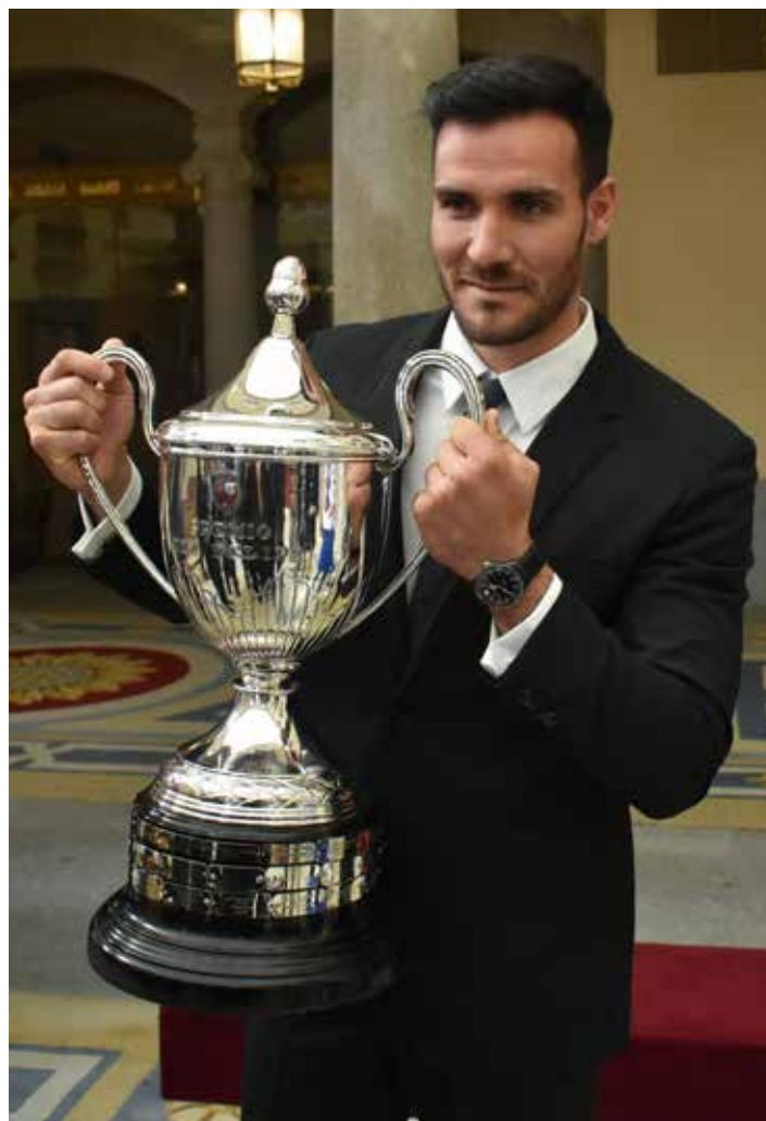
Saúl Craviotto, premio al mejor Deportista masculino

EL CUÁDRUPLE MEDALLISTA OLÍMPICO Saúl Craviotto recibió de manos del Rey Felipe el trofeo obtenido por su doble medalla olímpica en Río: oro en K2 200 junto a Cristian Toro y bronce en K1 200. El palista catalán dijo que este reconocimiento le da "ánimos" para seguir esforzándose y entrenando de cara a la próxima cita olímpica en Tokio 2020. Además, reveló que el "elevado" nivel competitivo existente en España en la actualidad obliga a aumentar el esfuerzo a cada uno de los aspirantes a formar parte de las distintas embarcaciones. Craviotto expresó el "orgullo" que siente por poder formar parte de la actual selección española de piragüismo, a la que