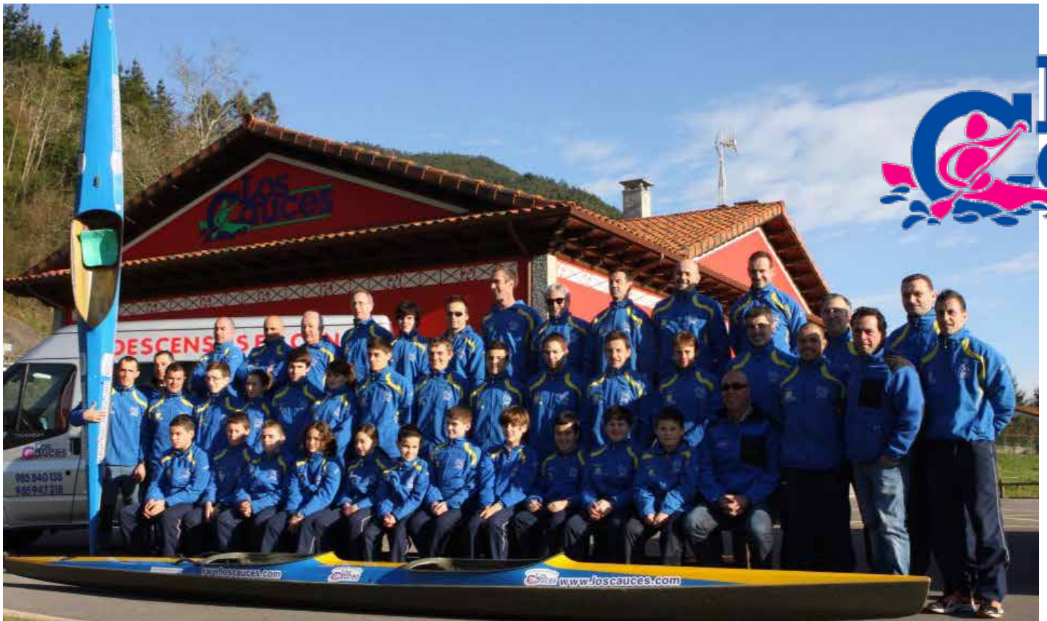
IMG. CLUB P. SIRIO. Presentación del patrocinio con los Cauces, año 2013.